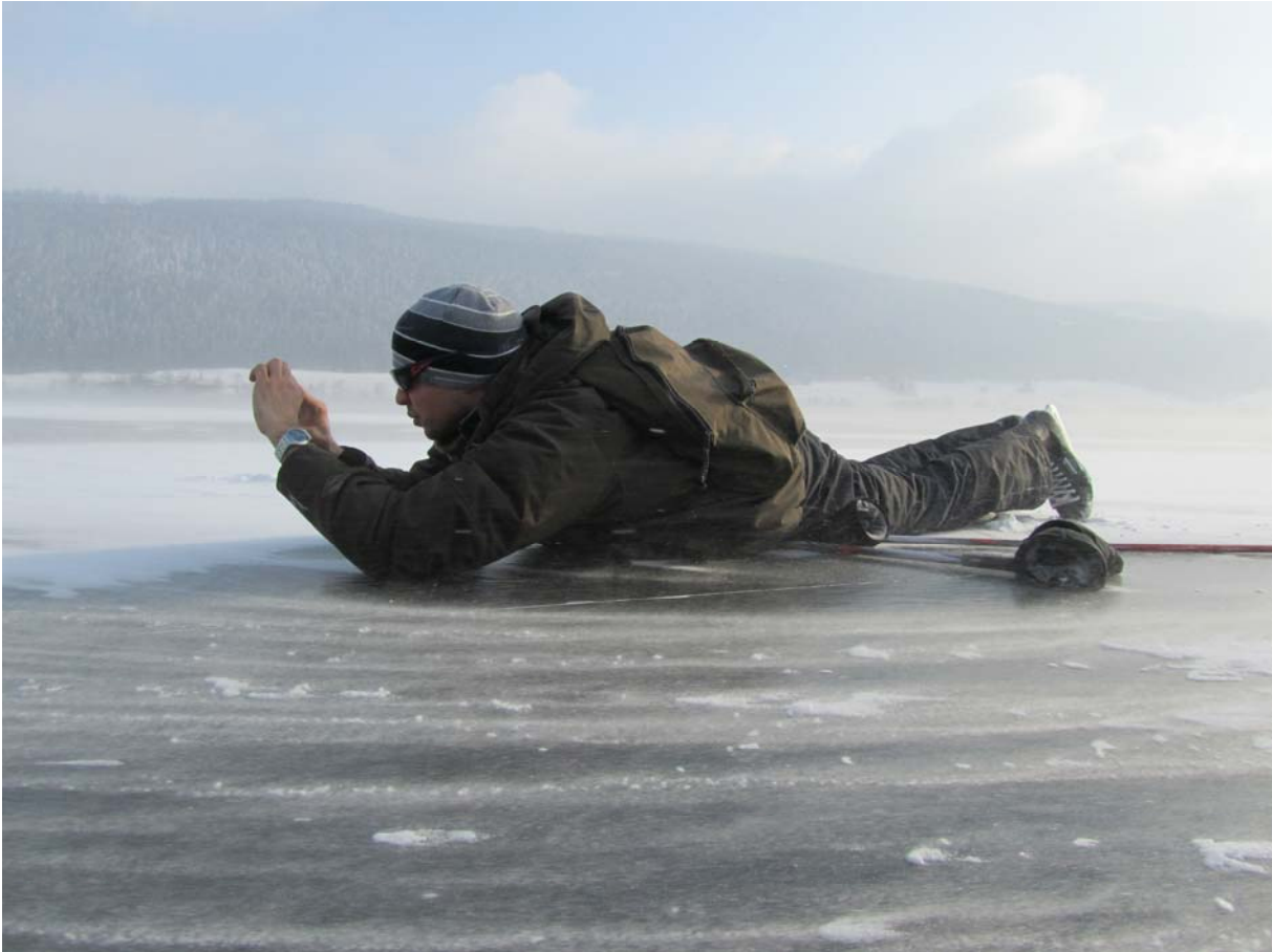
Une situation aussi cataclysmique mérite bien quelques photos.